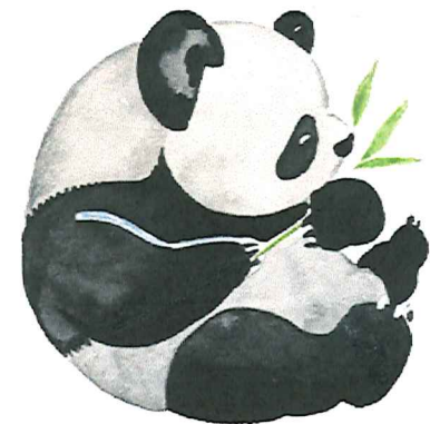
そろばんオリジナル クオカード

公益社団法人全国珠算教育連盟大阪府支部主催 そろばん年賀ハガキ当選番号 特等...高級ワンタッチそろばん(20000円相当) 2453 1等...アイスクリームメーカー 0728・1072・1741・2287・2310 2等...温泉たまご器 【下3ケタ】 097・134・211・373・472 512・653・752・837・992 3等...カプセル文房具セット 【下2ケタ】 01・15・20・30・44 52・63・74・87・91 ※景品との交換は2月1日から4月30日まで ※教室から送った年賀はがきが対象です